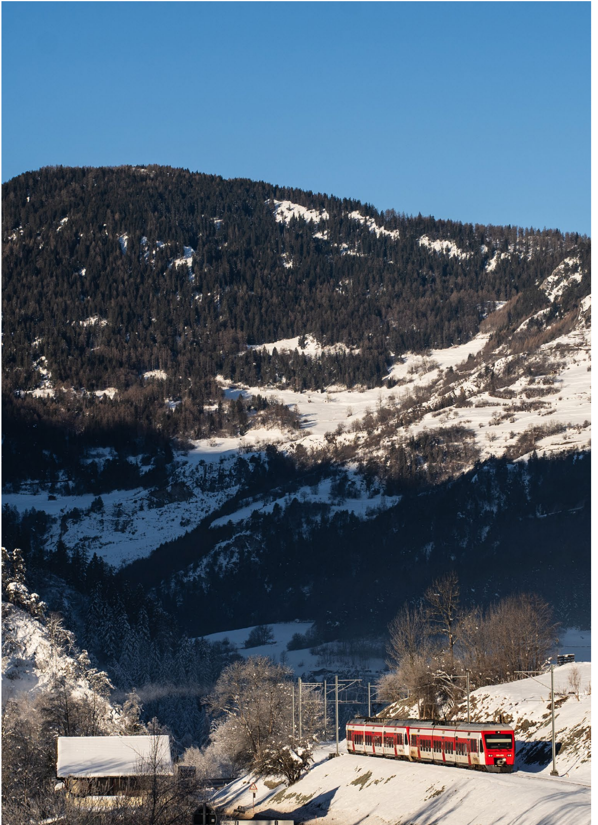
Train régional R81 en provenance de Martigny à l'arrivée au Châble sous les premiers rayons de soleil, 29.12.24